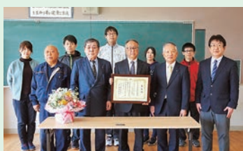
日教弘教育賞優秀賞 田老一中