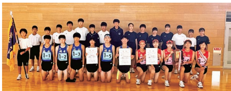
滝沢市立滝沢南中学校 駅伝チーム