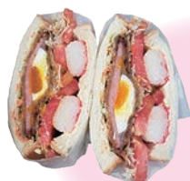
九戸萌え断サンド

高校生が地域の課題に向き合い、大人も巻き込んで、過疎化が進む九戸村の活性化につなげている画期的な取組である。また、地域の魅力の再発見に繋がり、新たな商品開発への意欲を持ち積極的に関わりたいという生徒も増え、地元の九戸中学校での発表会でも堂々とした発表が、中学生の大きな関心呼び、発表内容と併せて中学校から高い評価をいただいた。