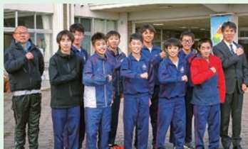
全国中学校駅伝入賞 滝沢中男子チーム

給付奨学金そして無利息貸与奨学金は青少年健全育成に直接的に役立っている事業ですし、教育研究助成事業や教育文化事業も、学校の教育活動の向上発展を通して、未来を担う子どもたちを育てるよう貢献しています。