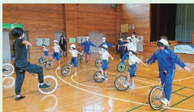
一輪車講習会 岩泉町立有芸小