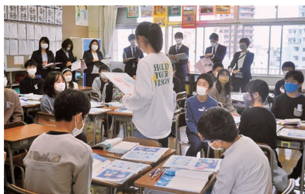
「ことばの交流」を大切にした授業 (R4 学校公開研究会より)