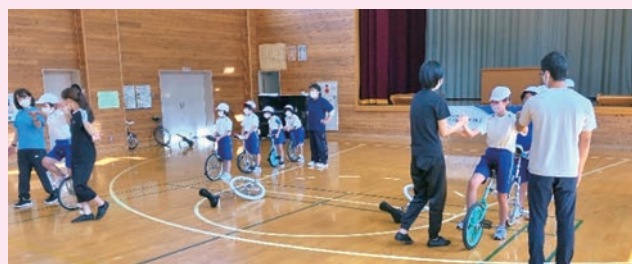
空中乗り（一人乗り）の基本を学び、全員挑戦！