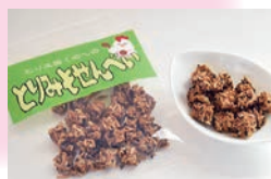
とりみそせんべい