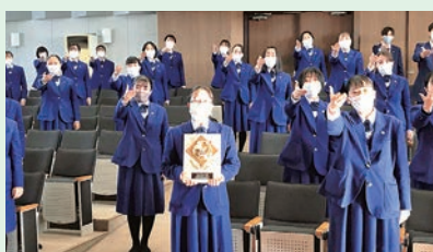
全日本合唱コンクール 最高賞 不来方高音楽部