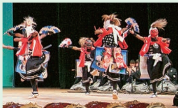
全国中学校総合文化祭