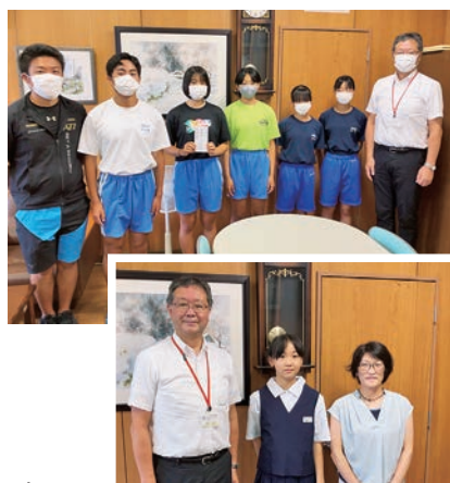
東北中総体に出場した大宮中学校 陸上競技部と剣道部の生徒さん